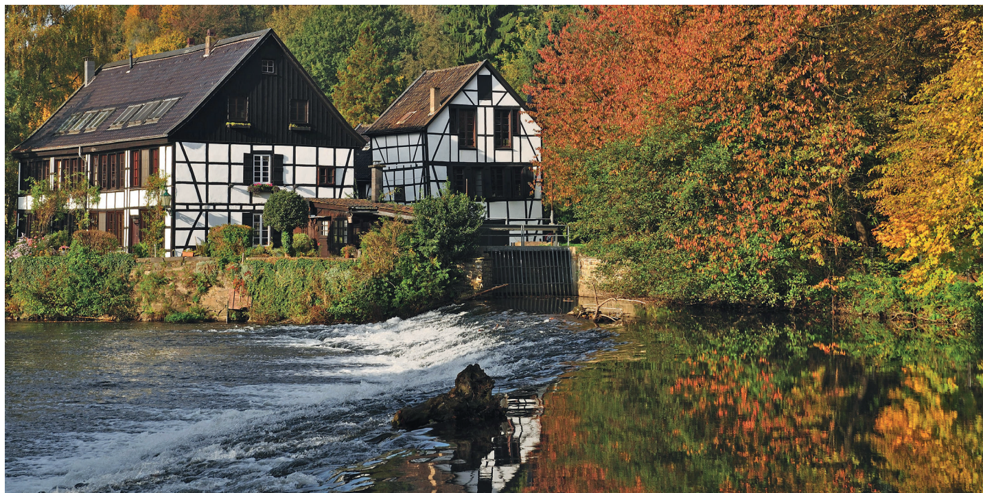
Wipperkotten - der GPV ist sehr heimatverbunden.

Die Idee des „Tags der offenen Tür“ war geboren. Ziel ist es, dass es jährlich eine offene Veranstaltung gibt, in der sich zwei Mitglieder des GPV vorstellen.